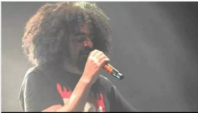
Caparezza - Eroe (Live Firenze, 11 Aprile 2012) di MrMagoafono