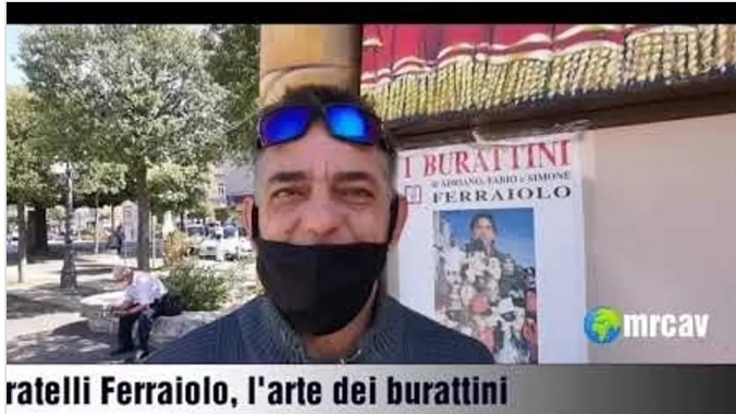
ratelli Ferraiolo, l'arte dei burattini

I Ferraiolo e il teatro dei burattini: da 4 generazioni nelle piazze del Sud